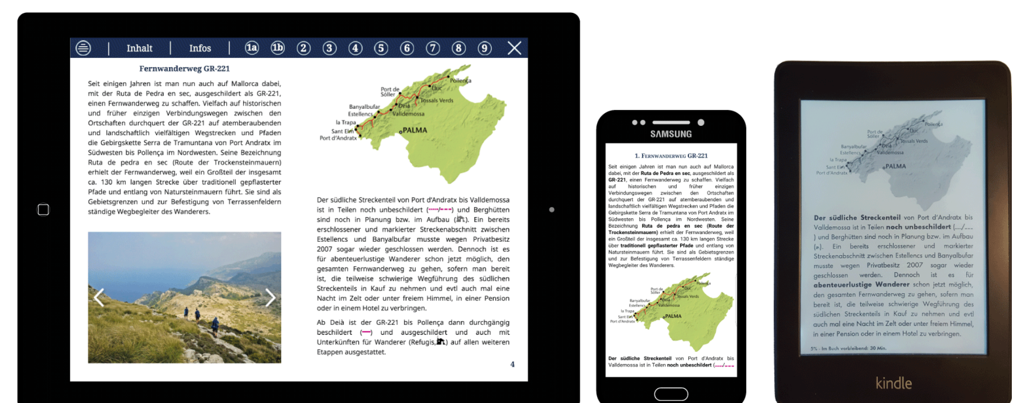
Der Wanderführer in drei verschiedenen Formaten auf unterschiedlichen Lesegeräten

Das offene E-Book Format ePUB 3 ist die am besten für den Wanderführer geeignete Publikationsform, denn sie ist auf beinahe jedem mobilen Lesegerät mit passender Software nutzbar und bietet mit dynamischen und statischen Layouts sowie der Möglichkeit zur Integration multimedialer und interaktiver Inhalte großes gestalterisches und funktionales Potential.